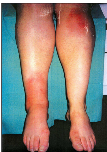
Bild: Erythema nodosum beim Löfgren Syndrom mit schmerzhaften Gelenkschwellungen